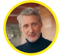
Antoine de Caunes